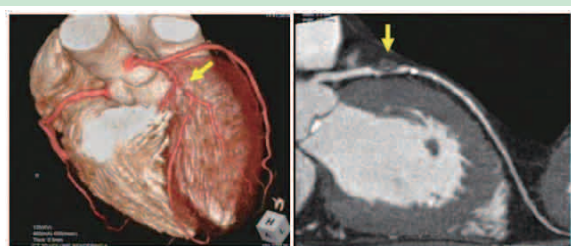
図1：MDC Tによる冠動脈造影検査

このような急性期医療は勿論ですが、当院は、心臓リハビリテーションにも力を入れています。